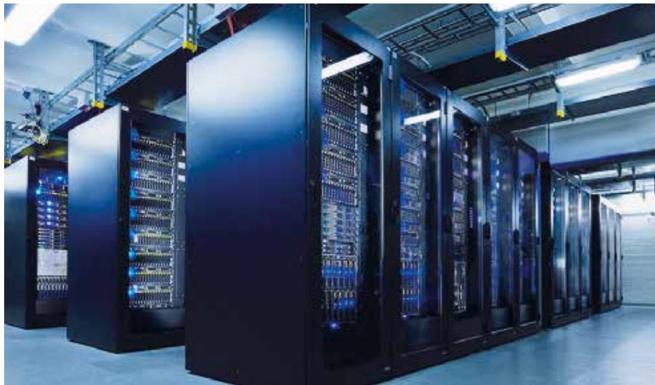
Wachsende Datenarchive: DESYs Forschungsanlagen produzieren riesige Datenmengen. Nachwuchswissenschaftler sollen in der neuen Graduiertenschule lernen, solche Informationen intelligent zu verarbeiten und zu nutzen.

Helmholtz-Gemeinschaft fördert neue Graduiertenschule mit 6 Mio. Euro