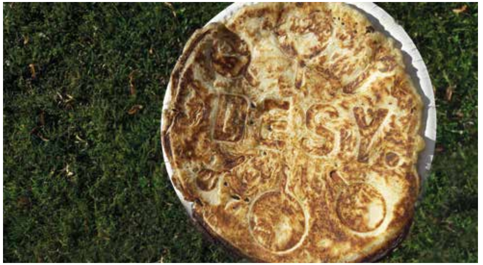
Neue DESY-Entwicklung: In Zeuthen gab es zum Sommerfest Waffeln mit Logo.

Mehr als 150 Kolleginnen und Kollegen feierten am 10. September das jährliche Campusfest in Zeuthen. Der Nachmittag begann mit einem Campusrundgang, bei dem Interessierte in die Projekte anderer Gruppen reinschnuppern und verborgene Gänge und Räume im Haus kennenlernen konnten. Austausch und Kennenlernen war auch beim anschließenden Sportprogramm möglich: Volleyball, Fußball oder Tischtennis. Zu den kulinarischen Besonderheiten zählten eine neue Kreation – die DESY-Waffeln, sowie saftige Cocktails, gemischt vom Leitungsteam. Für die Fest-Begleitung in den Abend sorgte die Zeuthener DESY-Band. (ub)