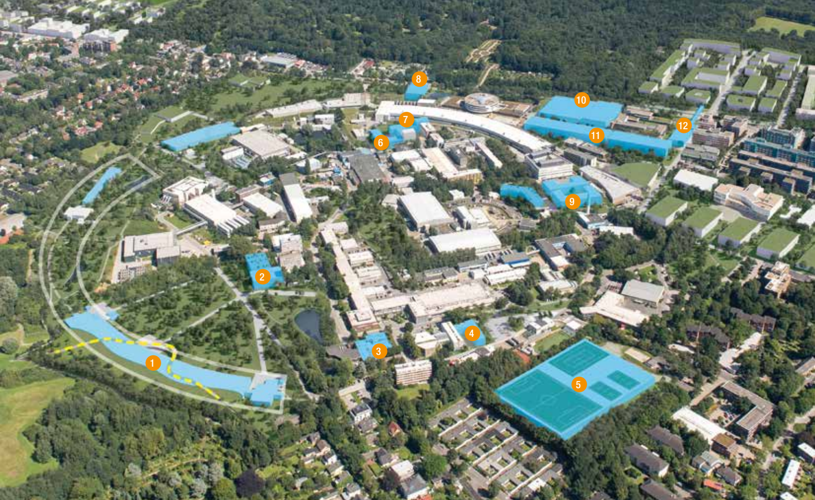
Bisher nur ein Entwurf: Bis 2030 sollen auf und rund um den DESY-Campus neue Zentren und Forschungsgebäude entstehen.