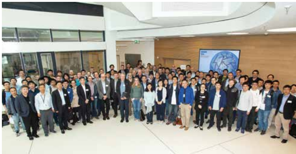
Internationale Zusammenarbeit in der FEL-Forschung: Deutsche und chinesische Wissenschaftlerinnen und Wissenschaftler bei einem Workshop im Juni bei DESY.