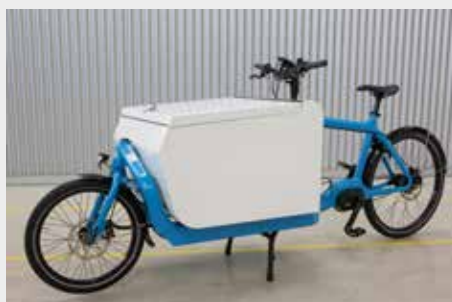
Buchbare Lastenträger: Bis zu 180 Kilogramm können diese Transporträder aufladen.

Im Rahmen des Projekts „Zukunftsfähiger Campus“ wurden drei Lastenfahrräder beschafft. Die Lastenfahrräder können bis zu 180 Kilogramm Zuladung aufnehmen und sind dank starkem E-Motor bestens für den schnellen Transport auf dem Campus geeignet. Die Räder können