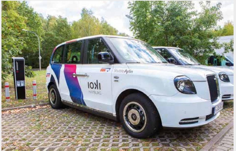
Elektrisches Sammeltaxi: Die IOKI-Shuttles lassen sich per App bestellen.

Mobilität ist gerade in der Großstadt im Wandel. Immer mehr Menschen verzichten bewusst auf das Auto oder haben schlicht keinen Parkraum vor der eigenen Haustür und nutzen stattdessen den öffentlichen Nahverkehr oder das Fahrrad. Das gilt auch für die Mitarbeiterinnen und Mitarbeiter bei DESY. Im Rahmen des Ausbaus des Wissenschaftsstandorts Bahrenfeld gibt es das Teilprojekt Mobilität, das DESY sehr eng begleiten wird. Dabei sollen die Bedürfnisse aller berücksichtigt werden.