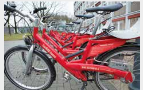
Leihbare Stadträder: Zukünftig soll es noch mehr Leihstationen auf dem Campus geben

über die Webseite wie alle anderen Fahrzeuge gebucht werden, sind aber kostenlos.