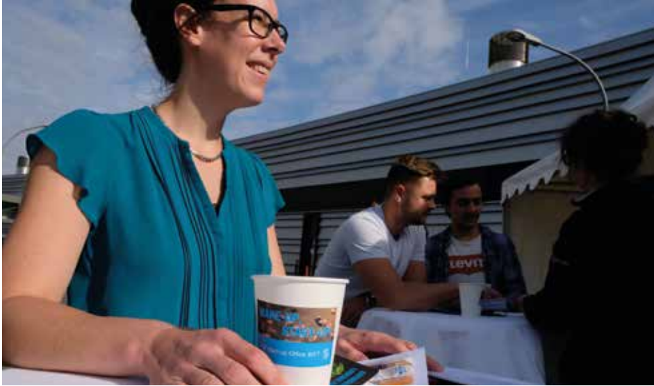
Drei Tage Kaffee und Fragen: Die Gründerberaterinnen informierten Interessierte über die vielen Aspekte von Unternehmensausgründungen.

Strahlender Sonnenschein, milde Temperaturen – besser hätte es nicht kommen können für das erste Coffee Camp-Out unter dem Motto „Wake-up, Start-up!“ des DESY Start-up Offices. Bei einer Tasse Kaffee Mitte September hatten DESYanerinnen und DESYaner die Möglichkeit, sich zu informieren, wie DESY Ausgründungen aus dem Forschungsbetrieb unterstützt. In der Strategie „DESY 2030“ ist festgehalten, dass DESY Ausgangspunkt für weitere Gründungen und Start-ups in den Regionen Hamburg und Brandenburg werden möchte.