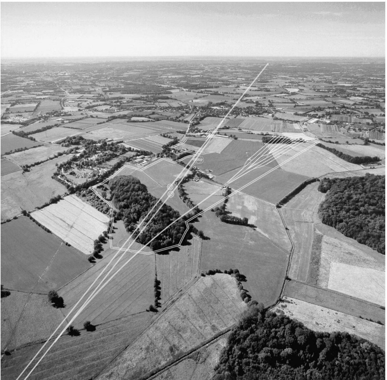
Abbildung 110: Geplante Trassenführung und Lage des FEL-Fächers im Bereich Ellerhoop.